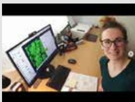
... bei der Arbeit