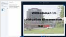
Unser virtuelles Klassenzimmer.