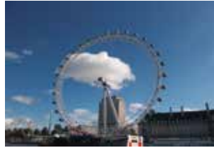
London Eye

jeweils ein Samstag, 10.00–17.00 Uhr, 8 Ustd./29,- €