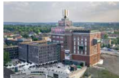
Gestaltung: Hannes Woidich, Dortmund

Näheres bitte telefonisch unter 0231/546 516-21 erfragen.