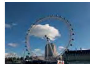
London Eye

jeweils ein Samstag., 10.00–17.00 Uhr, 8 UStd./24,- €