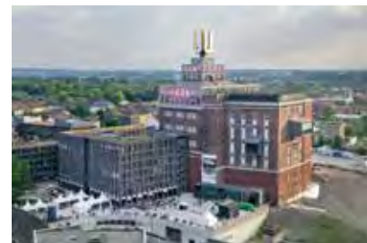
Gestaltung: Hannes Woidich, Dortmund

Vorkenntnisse zur Teilnahme sind ausdrücklich nicht erforderlich!