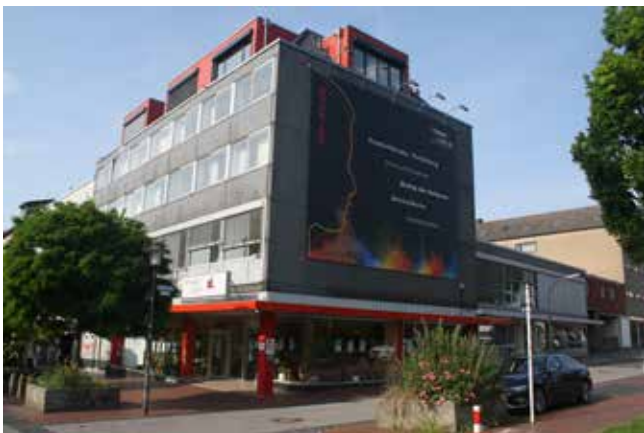
Die Münsterstr. 9-11 – hier ist das Weiterbildungsinstitut Ruhr zu Hause.

Erwartet Sie ein Vorstellungsgespräch in Präsenz, aber Sie fühlen sich noch unsicher? Machen Sie mit uns eine Generalprobe in einem virtuellen Einzeltraining. Sprechen Sie uns an!