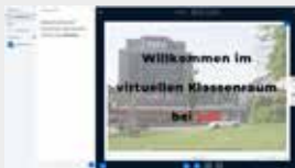
Unser virtuelles Klassenzimmer.