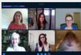
Bei der Online-Konferenz im virtuellen Raum ...