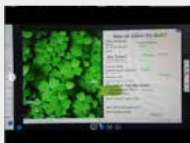
Ist das jetzt Glück?